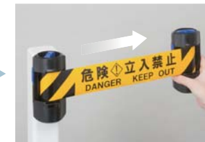
本体「右」を持ちながら、シートを引き出す。