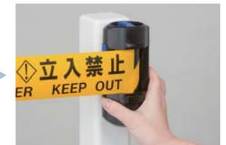
本体「右」を取り付ける。