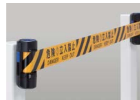
設置完了。 ※逆の手順(本体「右」から)での取り付けもできます。