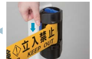
本体「右」を取り付け後、シートをロックする。