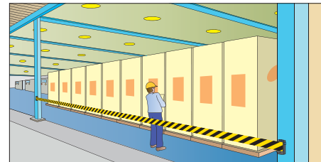
柱間隔の広い工場【黄/黒】