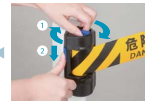
本体「左」に戻り、シートを増し締めしながらロックする。