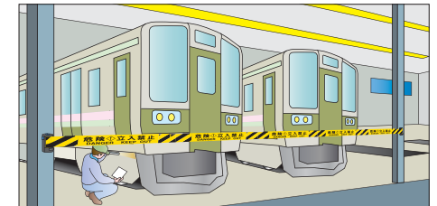
電車の整備場【危険立入禁止】