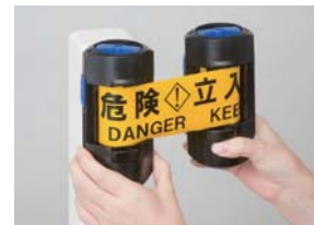
本体「左」を取り付ける。